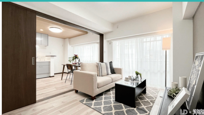
家具付き物件 2024年3月28日家具設置済